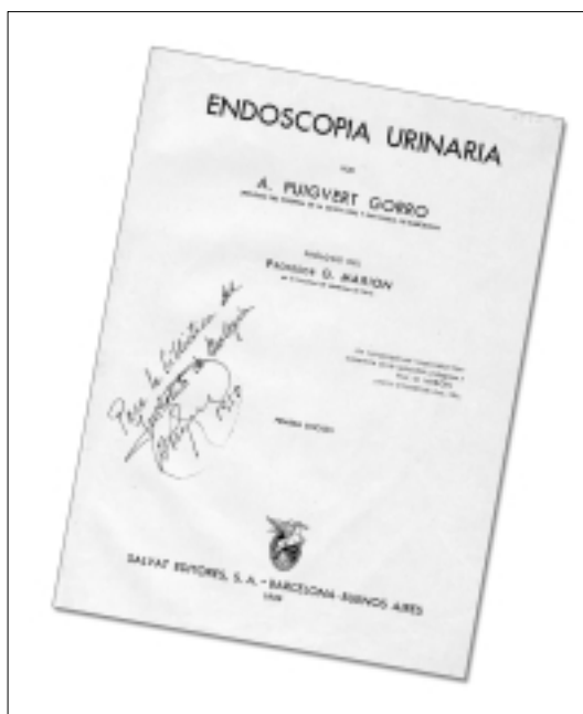
Figura 2. Reproducció de la portada de l'obra de Puigvert publicada l'any 1933.

Antoni Puigvert va morir a Barcelona el 18 de maig de 1990 després de viure vuitanta-cinc anys plens de treball i de realitzacions.