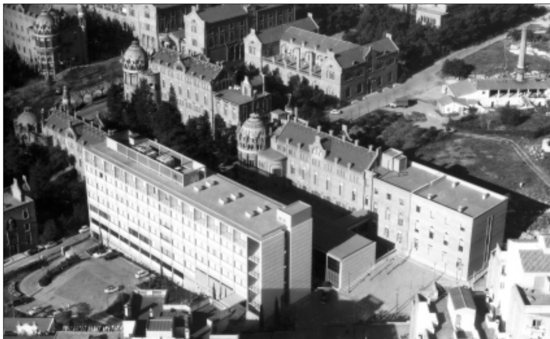
Figura 3. La Fundació Puigvert dins del marc de l'Hospital de la Santa Creu i Sant Pau.

La Fundació Puigvert nasqué amb la vocació d'oferir el millor tractament possible per a les afeccions que eren el motiu de la seva creació. El seu creador podia tenir una personalitat discutida, però no se li pot negar una gran dedicació a la seva professió, així com un desig constant i exhaustiu de fer que les coses rutlessin de la millor forma possible. El prestigi assolit per la Fundació des del principi, incrementat amb el pas del temps, l'ha convertit en una de les institucions capdavanteres de la pràctica urològica en l'àmbit internacional. Una vegada desapare-