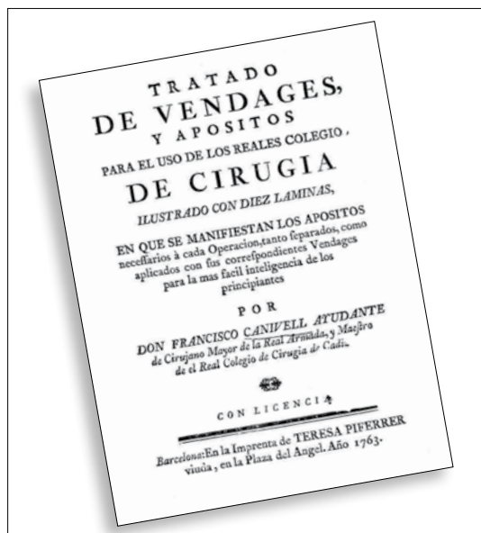
Figura 2. Portada de la principal obra escrita per F. Canivell ( Tratado de vendages, y apositos para el uso de los reales colegios de cirugia ) 13 , publicada a Barcelona l'any 1763.