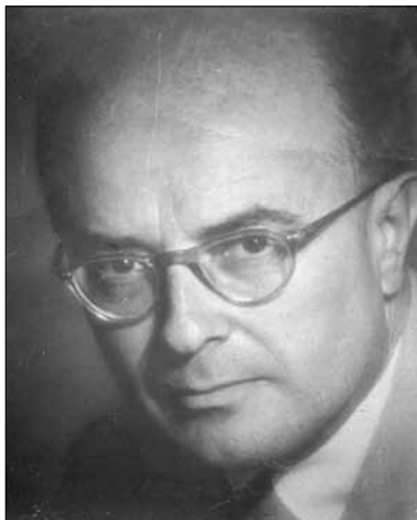
Figura 1. Emili Mira i López (1896-1964).

Durant l'època d'estudiant (1914-1917), com alumne intern, freqüentà el laboratori de l'Escola de Fisiologia de Barcelona, dirigit per August Pi-Sunyer, on va rebre influències del pensament positivista, els mètodes del qual emprà i que li donà una visió genètica i evolutiva dels organismes i una concepció unitària i funcional d'aquests organismes (unitat psicofísica del l'individu).