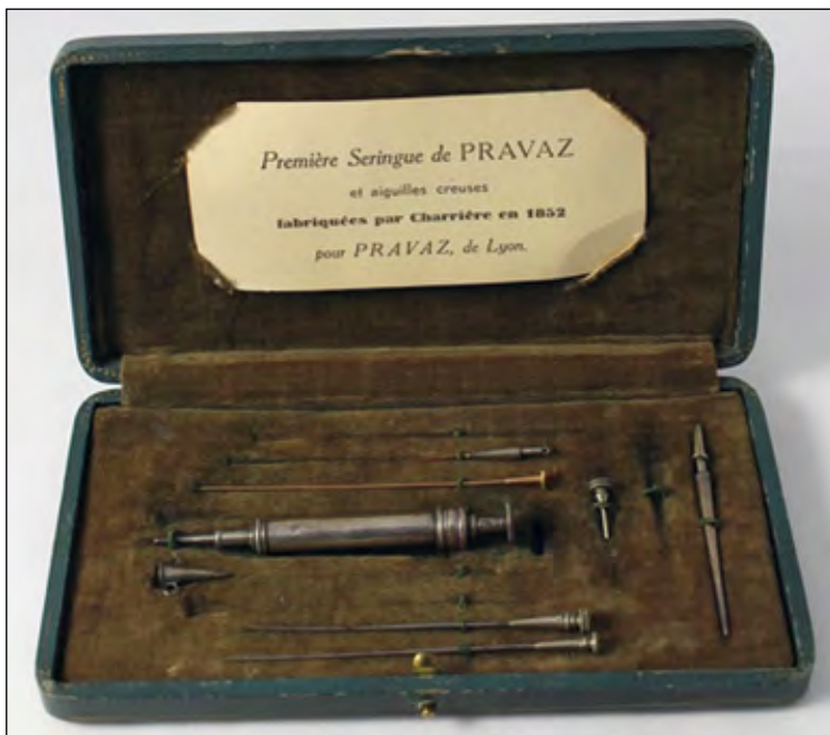
Figura 4. Xeringa de Pravaz, fabricada per Charrière l'any 1852 (Musée des Hospices Civils de Lyon).