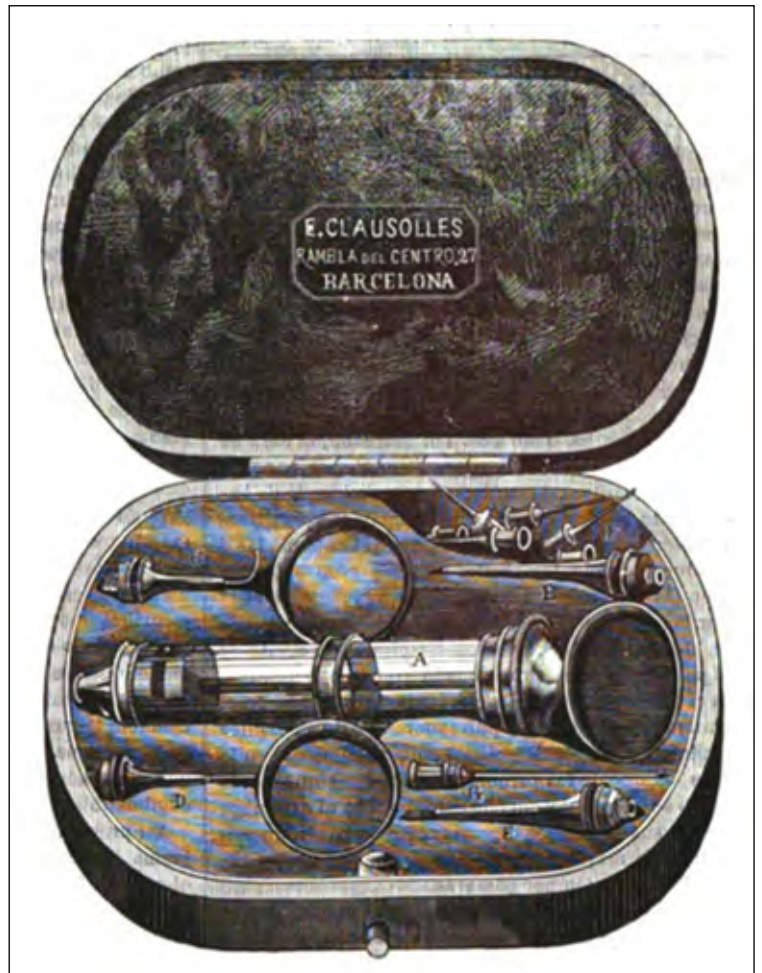
Figura 6. Xeringa universal del Dr. Giné 2 .

concepto, sumamente expuestas á obstruirse, por mas que se tenga cuidado de pasar por ellas el hilo metálico untado; tienen, además, el inconveniente de que no queda por ellas determinado el grosor del tegumento, y por lo mismo, los principiantes frecuentemente hacen intradérmicas las inyecciones que debieran ser hipodérmicas . El autor ha obviado estos inconvenientes sustituyendo las cánulas cilíndricas por una cónica terminada en un tornillo E, al cual se ajusta uno de los dardos tubulares F" (Fig. 6); aquestes característiques